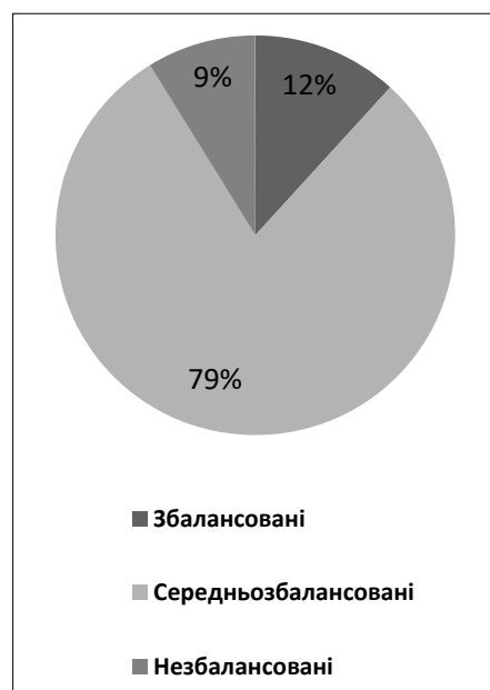
Рис. 1. Розподіл типів сімейних систем у багатодітних сімей

Взагалі, за результатами комбінування рівнів згуртованості та адаптації більшість багатодітних родин відносяться до середньозбалансованих (середньофункціональних) сімейних систем (рис. 1).