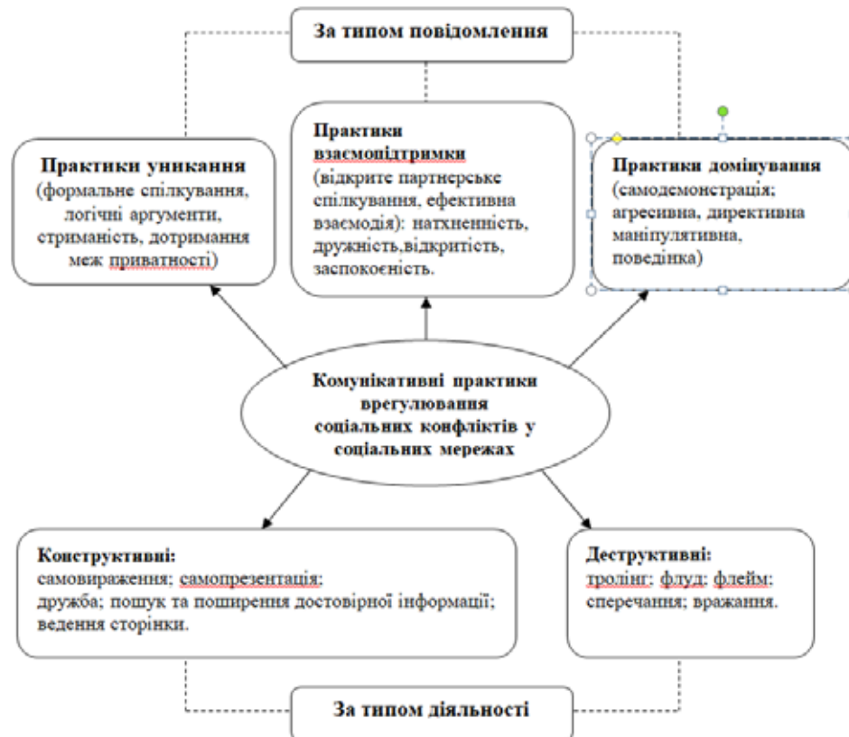
Рис. 2. Модель онлайн-практик як складника комунікативних технологій врегулювання соціальних конфліктів у соціальних інтернет-мережах

Вони мають можливість спостерігати за подіями в країні та світі без просторових і часових обмежень, самовиражатися й висловлювати свої оцінки, міркування та почуття стосовно них. У процесі загострення соціальних конфліктів, окрім бажання висловити свою думку, користувачі часто демонструють потребу в психологічній захищеності, розумінні, підтримці, безпеці, передбачуваності процесу комунікації. Крім того, вони докладають чимало зусиль для створення таких умов онлайн-діалогу в процесі розгортання соціального конфлікту, в яких відчувають стабільність і комфорт. При цьому вони зазвичай не обмежують доступ інших користувачів і мережевих спільнот до поширення й коментування публікацій про соціальні конфлікти.