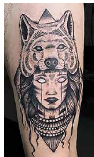
Рис. 10. «Вовк і обличчя». Майстер А. Цвигун