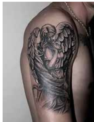
Рис. 6. Тату «Янгол». Майстер Ю. Віноградова