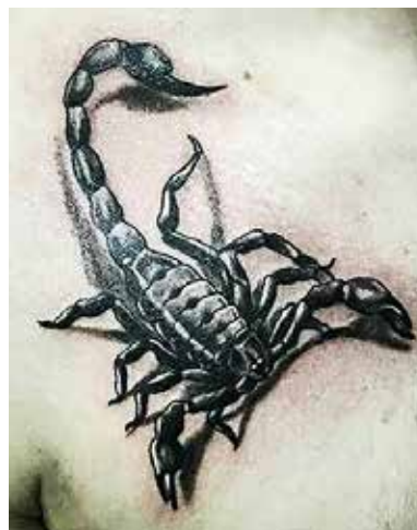
Рис. 2. Тату «Скорпіон». Майстер А. Кеваркова