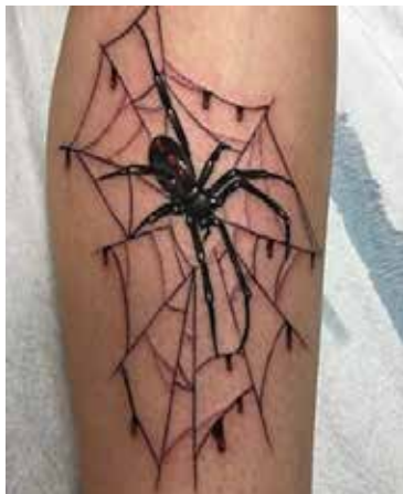
Рис. 3. Тату «Павук у павутині». Майстер D. Shaneyfelt

Тату має функціональне наповнення та глибинний смисл. Відомо, що малюнки на тілі людини мають сакральне й символічне значення. Подані вище класифікації характеризують загальні категорії та універсальне трактування символіки тату. Наприклад, для кримінального світу татуювання є невербальним способом спілкування.