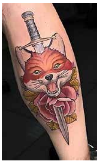
Рис. 8. «Лисиця». Майстер А. Цвигун