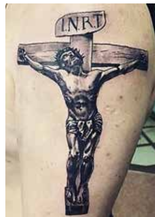
Рис. 4. Тату «Розп'яття Ісуса Христа». Майстер О. Руденко