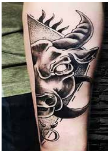
Рис. 1. Тату «Бик». Майстер Є. Сухов

Різноманітність і розповсюдженість татувань потребує умовного поділу їх на групи за різними