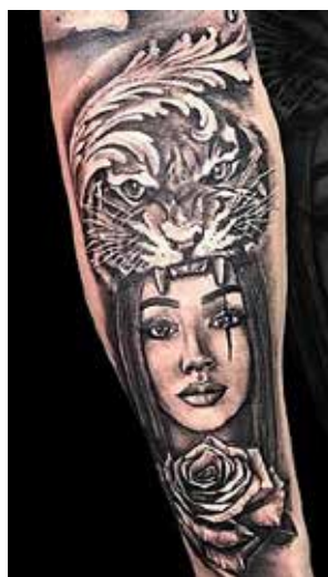
Рис. 9. «Тигр і дівчина». Майстер А. Кеваркова