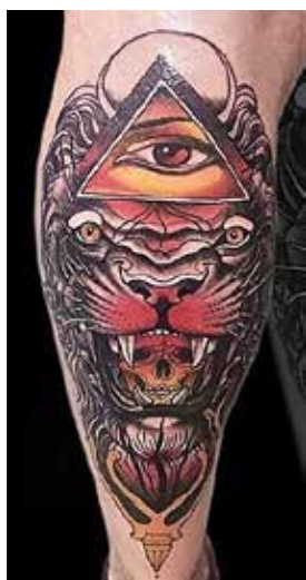
Рис. 7. «Лев». Майстер А. Кеваркова

Засновник психоаналізу З. Фрейд у праці «Тотем і табу» писав, що примітивна людина татує на своєму тілі зображення тотемної тва-