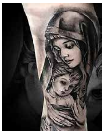
Рис. 5. Тату «Богородиця з Ісусом». Майстер С. Хандубей