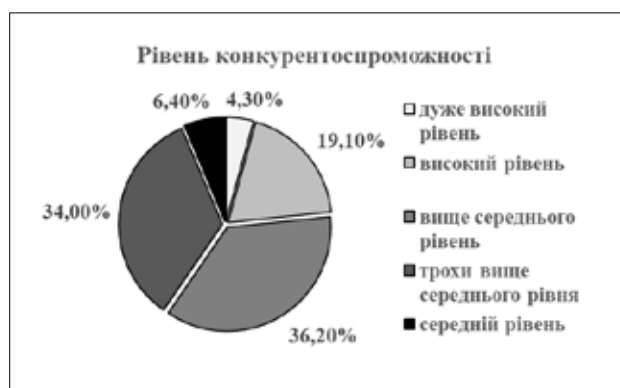
Рис. 2. Результати дослідження за методикою «Оцінка рівня конкурентоспроможності особистості» В. Андреева