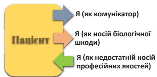
Мал. 1. Модуль «Я – інший»

Елемент «Я – інший» (Мал. 1) займає 39% з усіх страхів. Він включає страхи, пов'язані з негативною комунікацією з пацієнтом, страхом пацієнта як носія біологічної шкоди, невпевненістю лікаря у власному професіоналізмі. У цей модуль були віднесені страхи 4, 7, 9, 14.