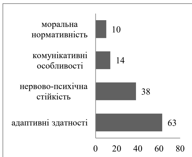
Рис. 3. Середні показники за шкалами методики «Адаптивність» групи респондентів юнацького віку

ний з тенденцією до зниження нервово-психічної стійкості. Було виявлено, що за статевою ознакою, юнаки краще адаптуються до змін, ніж дівчата.