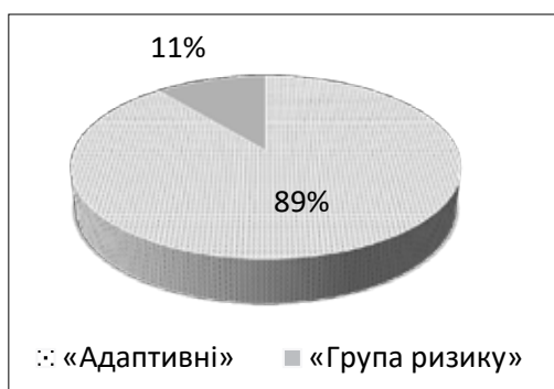
Рис. 1. Результати кластерного аналізу групи учасників антитерористичної операції