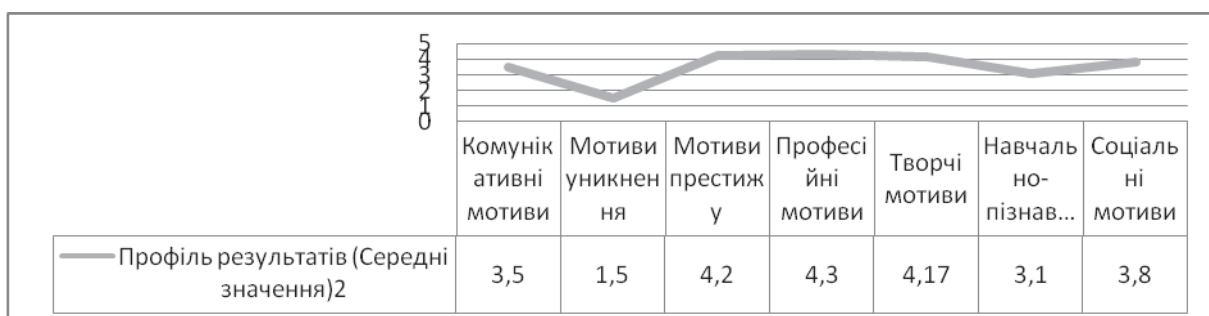
Рис. 2. Графічний профіль показників за методикою навчальних мотивів студентів (середні значення)

Результати за шкалами інтернальності й екстернальності майже подібні. Інтернальність, або високий самоконтроль і саморегуляція, що допомагає людині самореалізуватися, виявлена в 57% опитаних, екстернальність, тобто низька самоорганізація в процесі самореалізації та перекладання відповідальності на інших спостерігається в 43% студентів.