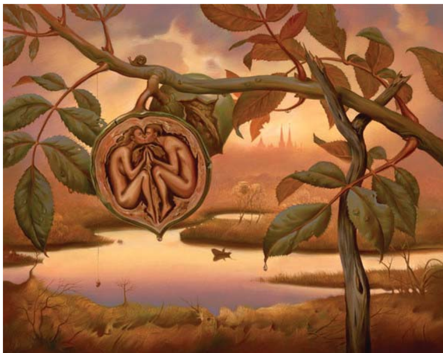
Рис. 4. В. Куш, «Горіх Едему»

У контексті психоаналітичної роботи з Я. засвідчується значуща сила архетипної символіки, зокрема: будинок – символ утробы; його квітковість – любов до брата (та інших лібідних об'єктів); підняття будинку над землею – неможливість реалізувати «лібідне» єднання тут, на землі, на яке є «Табу»; ланцюг на курячій ніжці – архетипний символ пуповини; зламані східці – символізують труднощі повернення в утробу; ланцюги на підвіконні – натяк, що ще хтось є, хто «пуповинно» причетний до респондента.