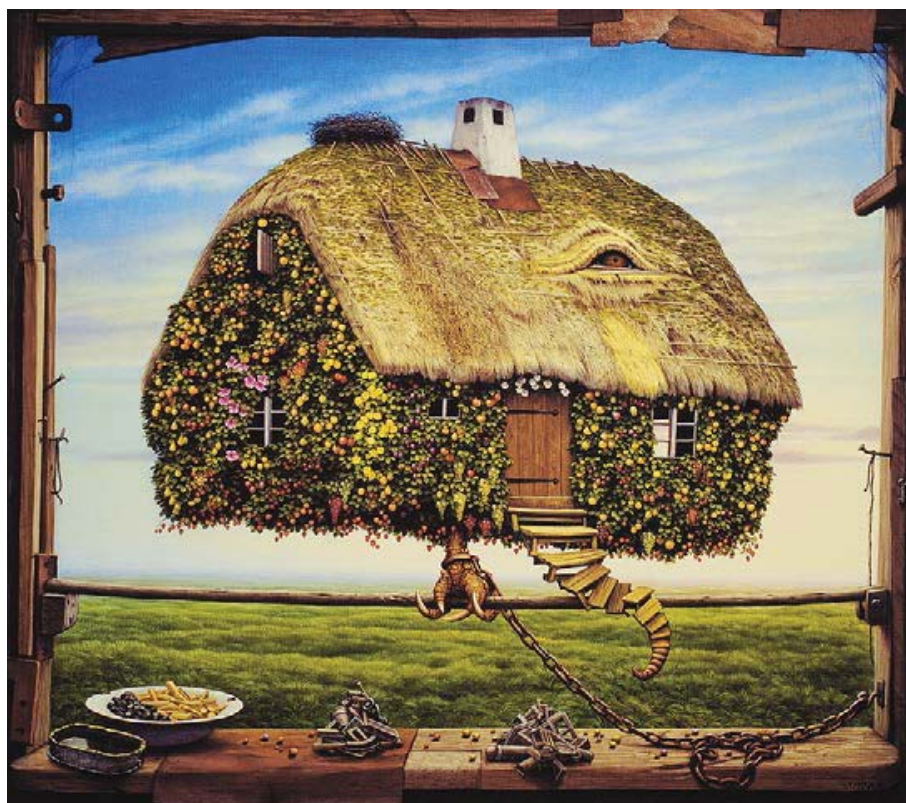
Рис. 3. Я. Єрка, «Повна миска»

Я.: Так, так воно і було, тепер я розумію, що через це були розірвані ним стосунки зі мною, він просто не витримав. Тоді я це відчувала, але переконувала себе, що це нормально, нехай про-