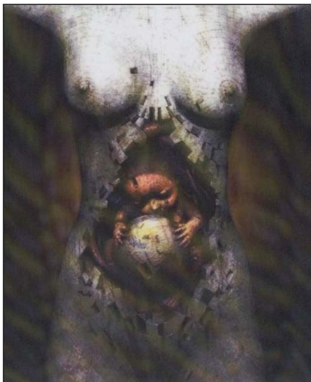
Рис. 2. Д. Хо, «До народження»

П.: Чим відрізняються особисті аспекти від тих вражень, які ти несеш, згідно з цим ланцюгом, як пуповину, що зв'язує тебе з дитинством? Як ти відчуваєш, як змінилася б кольоровість на цьому будинку, якби це були твої особисті стосунки, що б тут з'явилося ще?