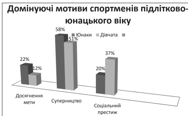
Рис. 2. Відмінності в домінуючих мотивах у спортсменів підлітково-юнацького віку різної статі

Результати дослідження за методикою «МАС» М.Л. Кубишкіної, спрямованої на виявлення устремління (мотивації) людини на досягнення мети, суперництва (азартності) та устремління до соціального престижу, представлені графічно на рис. 2.