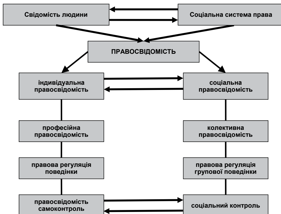
Рис. 1. Схема структури семантичного поля поняття правосвідомості за О.В. Кобцем

Юридична діяльність за своїм змістом завжди є професійно правовою діяльністю. Саме в цьому полягає її відмінність у соціально-психологічному аспекті від діяльності громадян за безпосередніх форм реалізації норм права в повсякденних відносинах. Аналіз сучасних досліджень у галузі загальної та юридичної психології свідчать про високу наукову актуальність вирішення проблеми правосвідомості особистості, зокрема правосвідомості фахівців юридичного профілю діяльності. Свідомість є безпосереднім джерелом активності особистості і регулятором її поведінки, сама випробовує регулюючий вплив зовнішніх явищ (наприклад, криміногенної субкультури, відношення до юридичних органів розповсюдженої завдяки засобам масової інформації в нашому суспільстві та ін.).